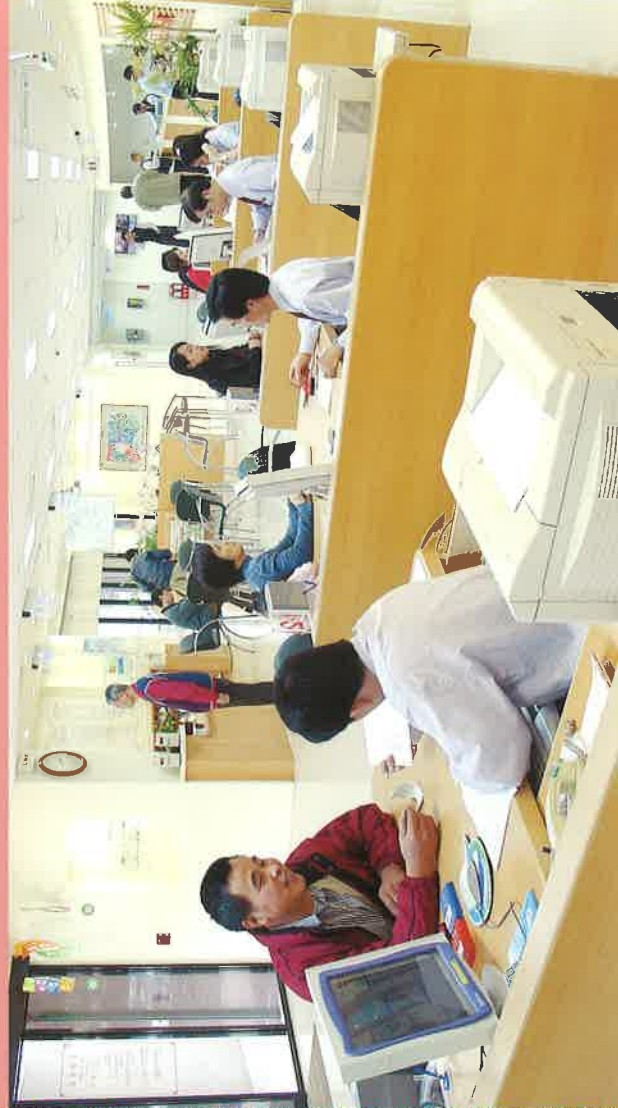
台北南區營業處服務中心

我們知道電價該如何制定，最基本的方式就是衡量成本後訂出價格，豈料，近年來國際燃料價格高漲，電價調整卻遠遠不及燃料漲幅。